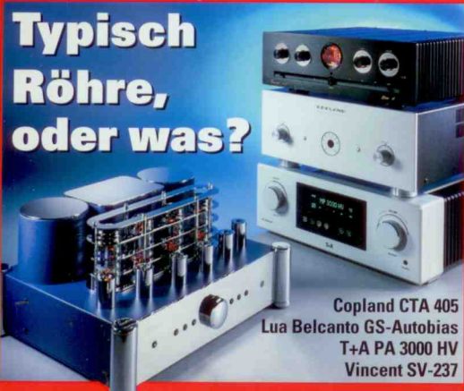
Copland CTA 405 Lua Belcanto GS-Autobias T+A PA 3000 HV Vincent SV-237